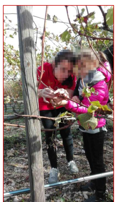
Gli alunni della classe 1 A